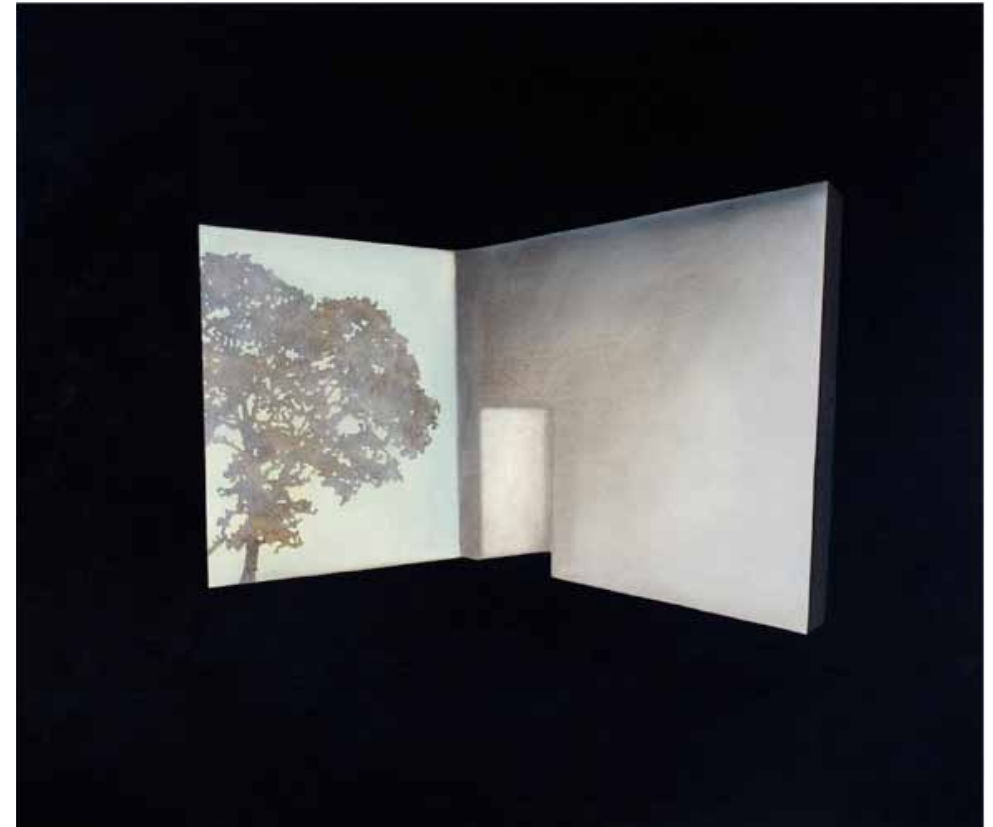
Fabian Patzak Bühne nach Innen/Außen Öl auf Leinwand, 2010 106 x 90 cm Schätzwert: 2.200,-- Rufpreis: 1.000,--